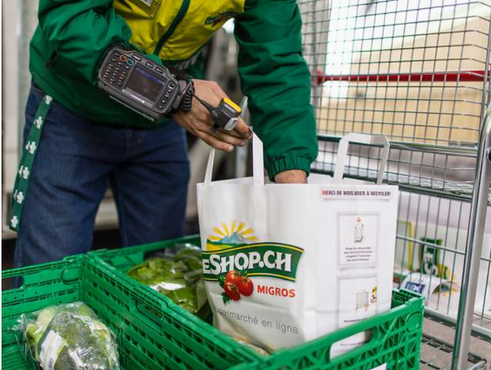
Gefragter Service: Ein LeShop-Mitarbeiter stellt eine Bestellung fertig. (Archiv) KEYSTONE/GAETAN BALLY

N° de thème: 284.005 N° d'abonnement: 1074277