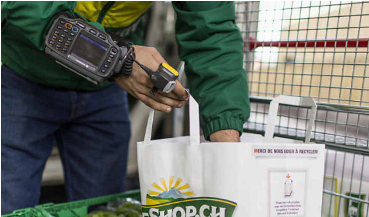
Gefragter Service: Ein LeShop-Mitarbeiter stellt eine Bestellung fertig.

LeShop hat im vergangenen Jahr ein Umsatzplus von 6,6 Prozent auf 176 Millionen Franken verbucht. Der nach eigenen Angaben grösste Schweizer Online-Supermarkt rüstet sich aber bereits für einen harten Konkurrenzkampf.